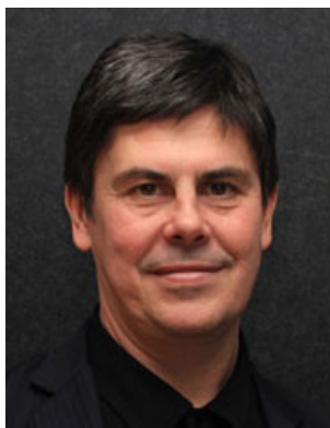
Arquitecte en cap del Govern Peter Poulet [Nova Gal·les del Sud]