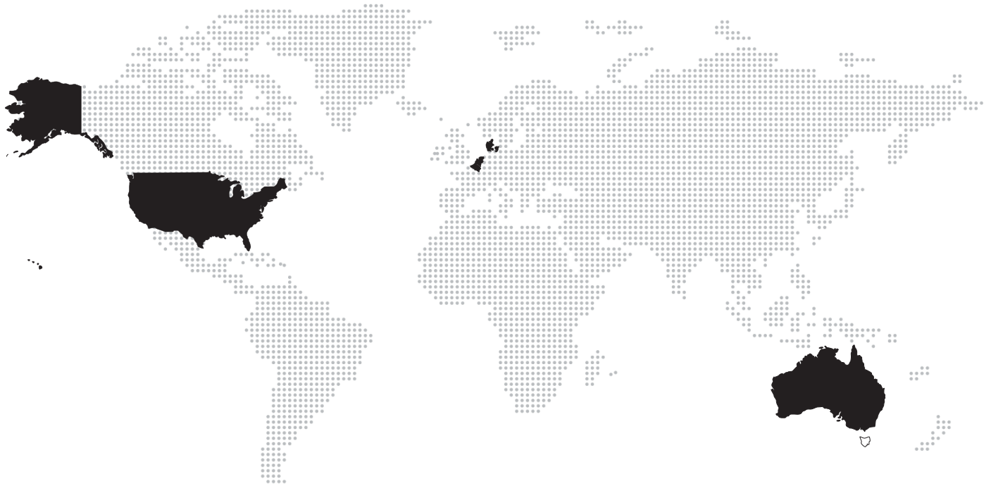
Mapa mundial amb l'Arquitecte del Govern com a membre del Govern local.