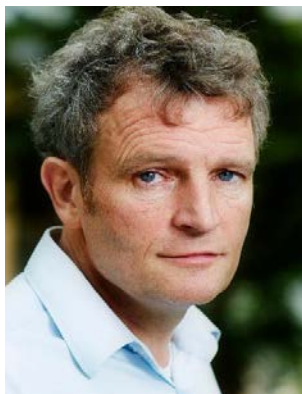
Arquitecte en cap del Govern Floris Alkemade [Països Baixos]