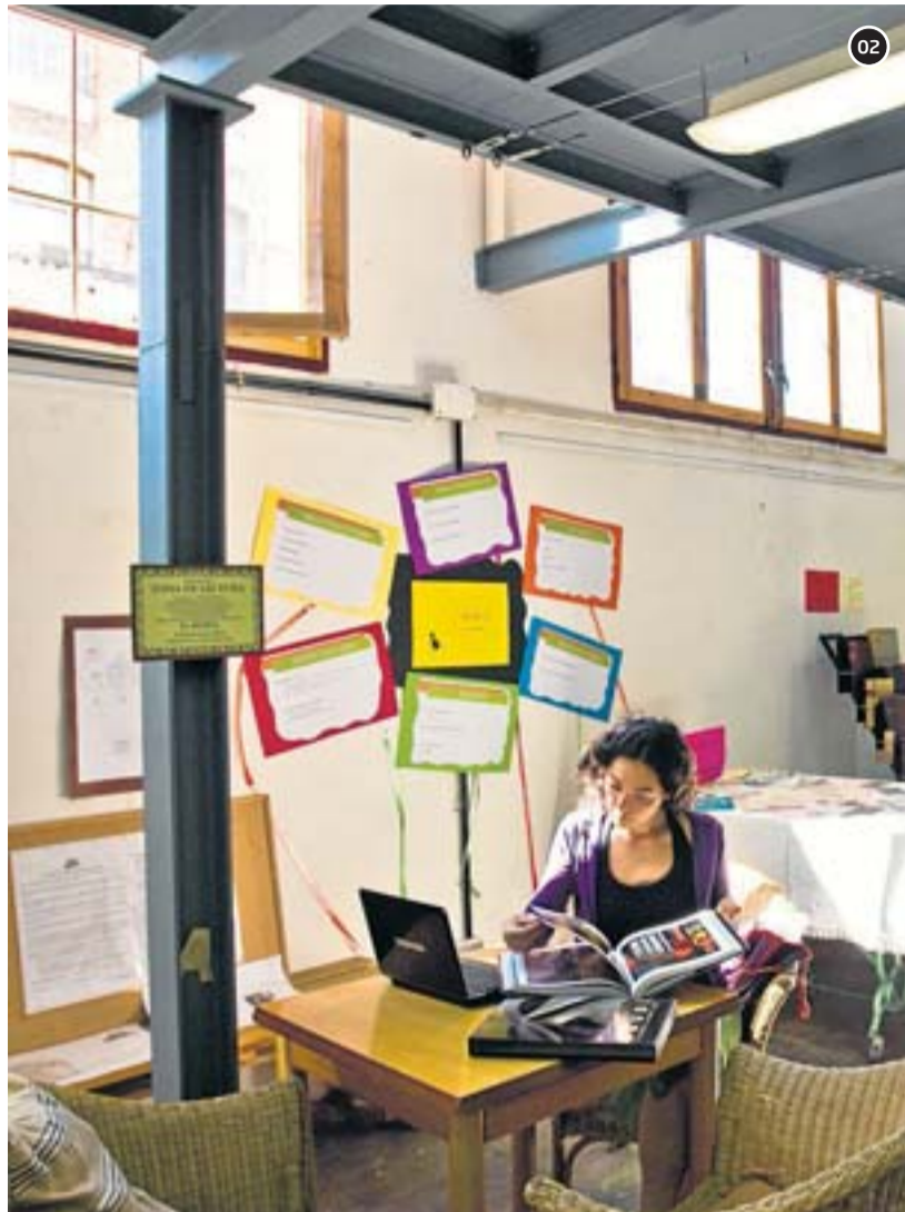
La maqueta de Barcelona del COAC s'ha convertit en la icona del congrés. 02. Can Batlló reflecteix la participació ciutadana en l'arquitectura. 03. Storefront va fer un concurs de projectes amb el lema de la urgència.

La guerra judicial entre el consistori i les filles de Muñoz Ramonet va començar el 1994. En el procés penal, a les filles de l'industrial se les va acusar de delictes d'apropiació i estafa processal. Quan l'equip d'Ada Colau va entrar al consistori, s'hi va sumar una nova acusació: saqueig. En el procés penal també s'ha personat com a acusació l'Advocacia de l'Estat. "Les filles de Muñoz Ramonet han fet servir tot tipus d'argücies per no col·laborar amb la justícia -va dir Asens-. Sorpren que algú que té un Premio Nacional de cultura tingui aquesta actitud", va afegir. "Anirem fins al final", va assegurar el regidor de Cultura, Jaume Collboni. —