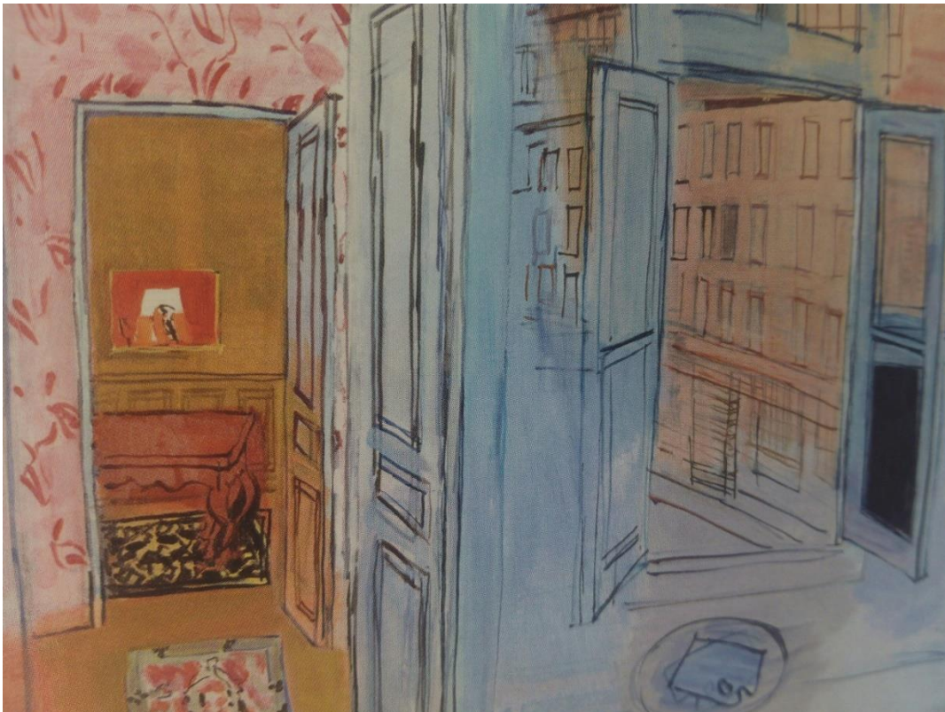
(*) "El estudio de Impasse Guelma" Raoul Dufy (1877 -1953 Francia) "El marco rectangular que conecta la habitación con el exterior es una metáfora de la dualidad entre el trabajo y el aire libre, entre el paisaje real y el paisaje construido". Publicación y exposición del Museo Thyssen Bornemisza.

Barcelona está preocupada por su barrio histórico, por su transformación sutil y delicada que puede llevarle a perder su identidad. No hay normativas, ni procedimientos que dominen o puedan regir, sin error, los intangibles que la complejidad ciudadana, cultural y creativa soporta y que la arquitectura debe saber sintetizar en proyectos concretos.