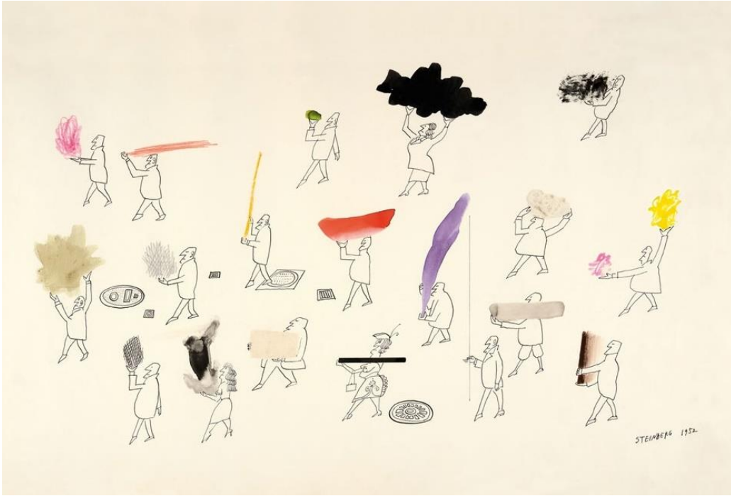
(*) Saul Steinberg (1914 Rumania – 1999 Estados Unidos). CITY – “The line explains, defines details through accumulation or on the contrary the absence of details (ellipsis), the identity of the city, the anonymity of crowds, the isolation of the individual, the disparate style of the architecture finally facing the observers with his own universe”. Museo de Strasburgo, exposición Saul Steinberg “Keywords”.

Europa tiene ahora la oportunidad de interpretar su crecimiento y aprender de sus propios logros y errores.