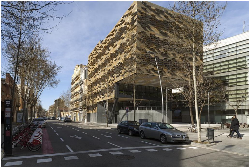
Pich-Aguilera, arquitectos/Picharchitects. Centro Científico Tecnológico "Leitat". Calle Pallars. 22@ Innovación Districte de Sant Martí. Barcelona.

Por último transmitir que las experiencias más gratificantes que en el despacho hemos tenido están ligadas a aquellos proyectos en dónde más allá de nuestro trabajo, hemos podido implicar al propio cliente, a otros profesionales y a otras empresas para innovar, proyectar, construir, parametrizar y evolucionar continuamente desde la interacción que la complejidad nos reta, con la confianza que ésta no queda ahogada por la burocracia, sino enriquecida por la responsabilidad del conocimiento.