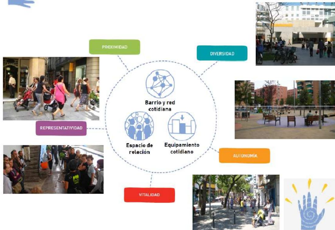
Fig.2: Diagrama sistema de indicadores compuesto por tres tipos de espacios y 5 cualidades urbanas. (Adriana Ciocoletto y Col·lectiu Punt6 2014).

La propuesta metodológica de este trabajo 3 se ha basado en analizar y evaluar las condiciones físicas de los espacios urbanos, para satisfacer los usos sociales a partir de las necesidades de la vida cotidiana, priorizando aquellos espacios que se utilizan en las tareas del cuidado y reproducción de la vida, incorporando aspectos de la realidad que hasta ahora se habían omitido en los análisis urbanos más generales.